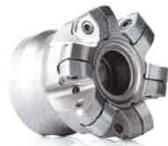
Fraises pour opérations de copiage