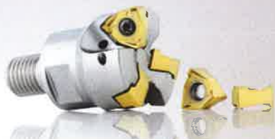
Fraises à surfacer-dresser