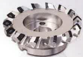
Fraises à surfacer